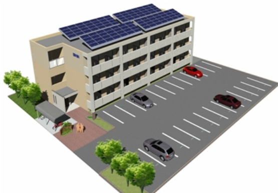
※グリーンパッケージ・イメージ

9月16～17日の2日間、長野市三輪において、次世代省エネ対応ブレインマンション完成内覧会を開催します。